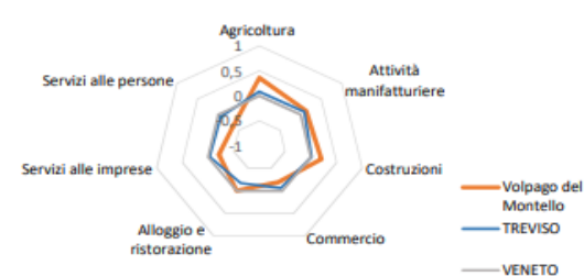
Indice di specializzazione